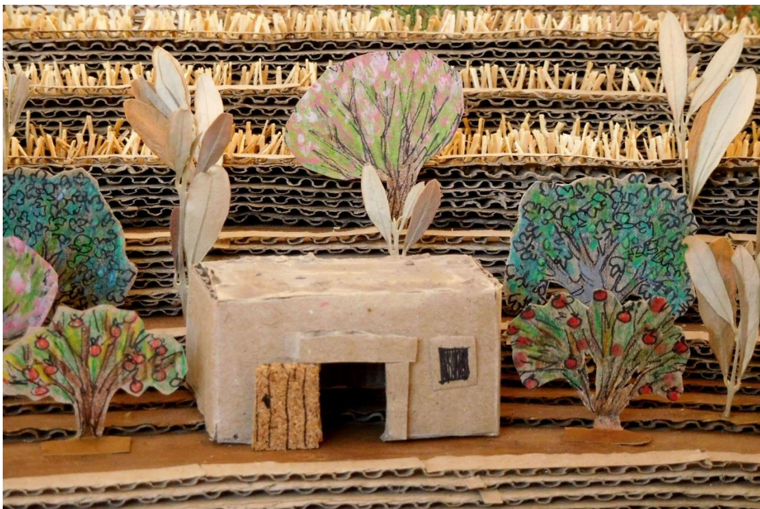
Εικόνα 4. Αγροκία με ροδιές και άλλα δέντρα.