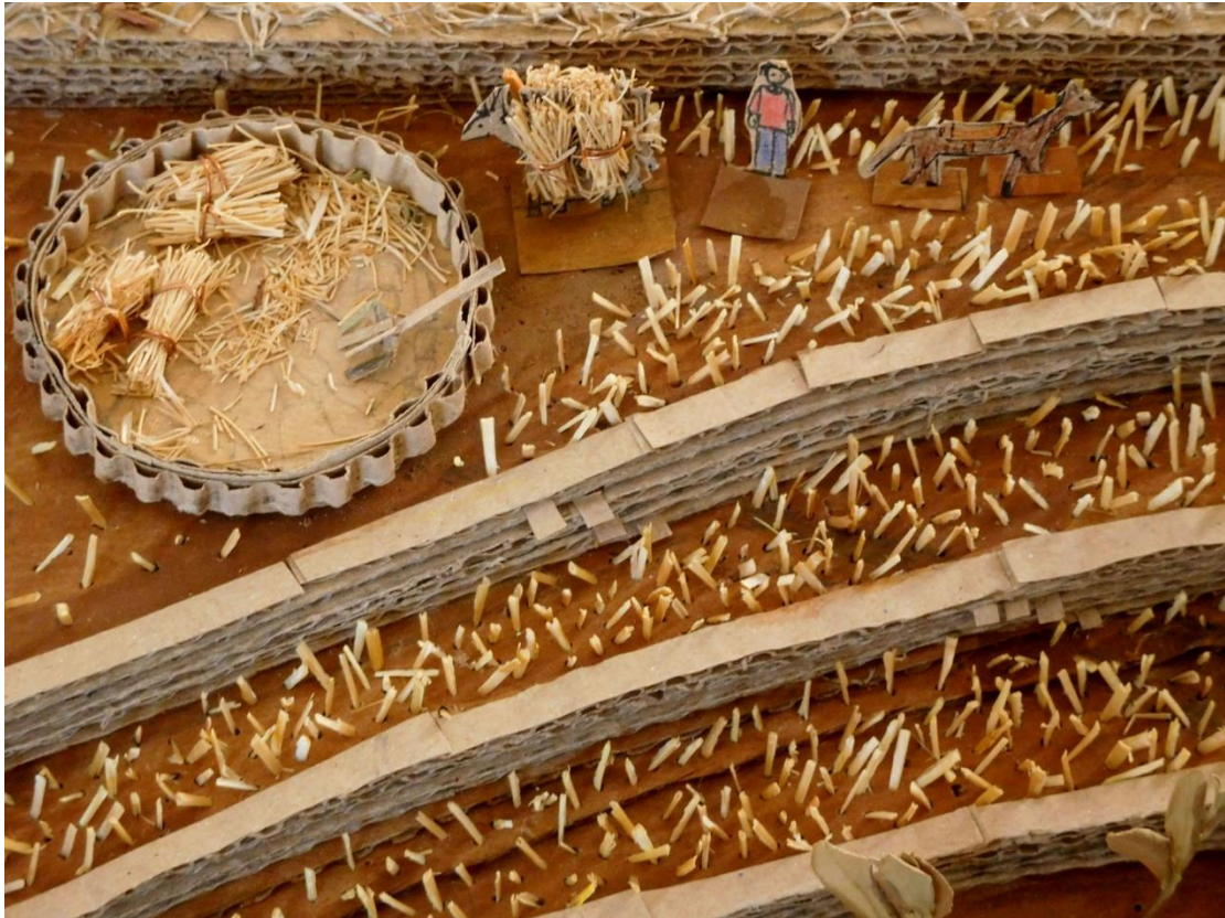
Εικόνα 3. Λεπτομέρεια. Αλώνι, εργαλείο για λίχισμα (πιρούνα) , αγρότης, ζώα εργασίας και στάχνα.