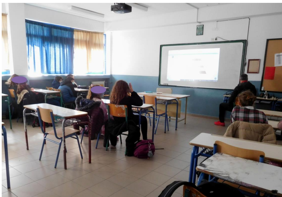
Εικόνα 1: Οι μαθητές/τριες της Α΄ τάξης συμμετέχουν στο διαδραστικό εκπαιδευτικό παιχνίδι.

https://phet.colorado.edu/en/simulations/eating-and-exercise/activities