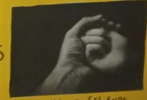
Πάντα σε βέβαια