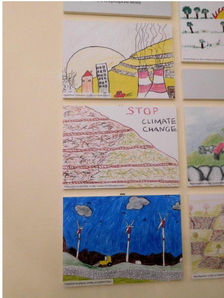
Εικόνα 1. Έργα των μαθητών Ποπηλίτσας Αμυγδαλιού και Δημοσθένη Πατακιούτη.