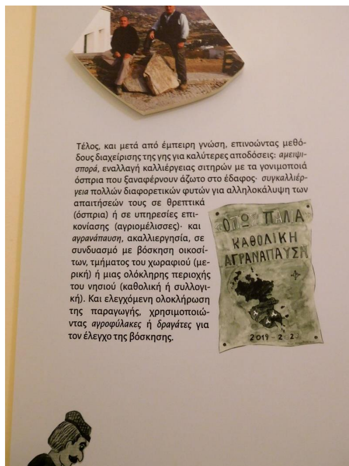
Εικόνα 3. Εκπαιδευτικό ενημερωτικό υλικό για τις αναβαθμίδες με εικονογράφηση αντλημένη από ακουαρέλες της Χ. Χρυσανθάκη. Η αφίσα για την αγρανάπαυση αναφέρεται στο νησί της Λέρον.